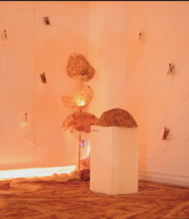
Rafaela Blanch Pires & Adriano Monteiro: DE/RE:GENERATION

und Mediensystem, das interaktive Klangkunst und Live-Performance verbindet. Acht Knotenpunkte im Netzwerk verarbeiten Bewegungsdaten, die von Kameras erfasst und mithilfe eigens entwickelter Computer-Vision-Software analysiert werden. Diese steuern die Klangerzeugung, werden im Netzwerk räumlich verteilt und formen so eine sich kontinuierlich wandelnde Klanglandschaft, die direkt durch die Interaktion des Publikums geprägt wird.